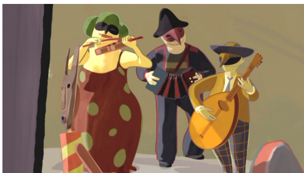
Musiciens à Venise (vidéo/musique diégétique)