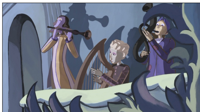
Musiciens au château

2) Les musiques « d'action » (ce que JFL appelle « musique de film »).